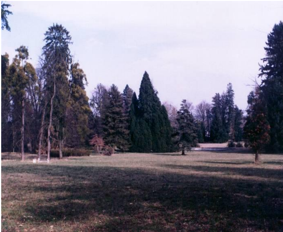
Pogled na dio Arboretuma Opeka i egzotično drveće