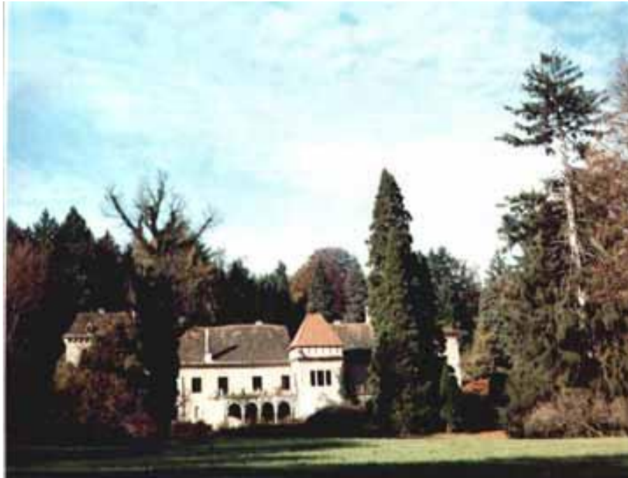
Dvorac Opeka danas vapi za obnovom