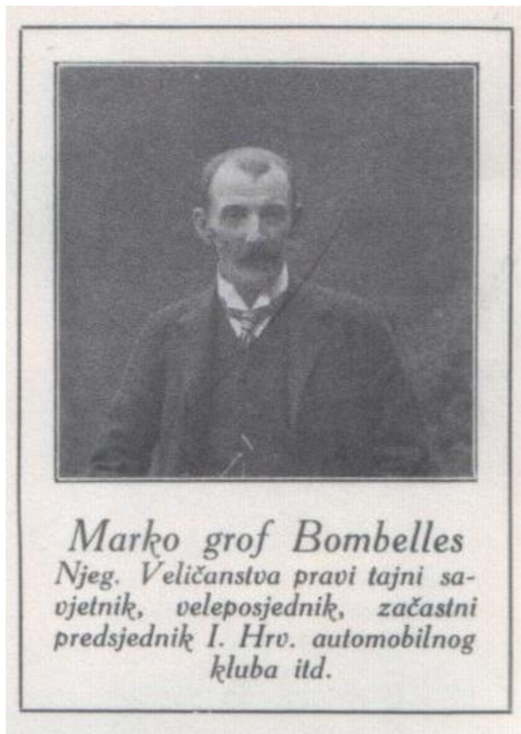
Grof Marko Bombelles mlađi