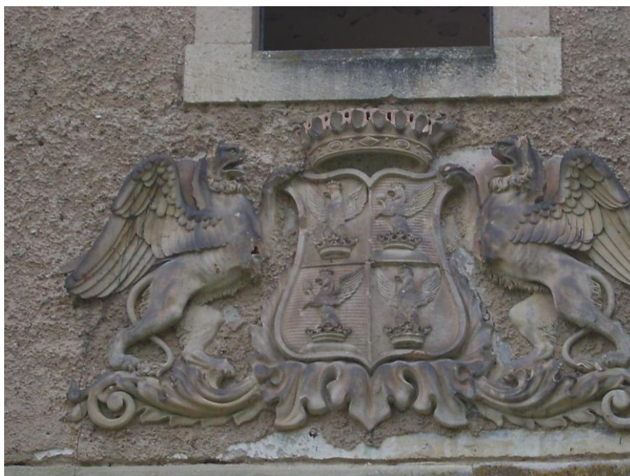
Grb plemićke obitelji Drašković na pročelju dvorca