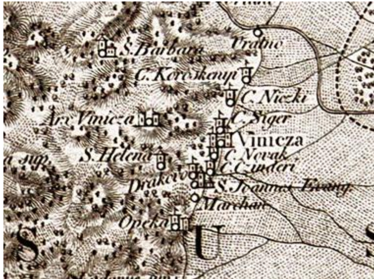
Zemljovid dijela Varaždinske županije i Beyschlaga iz 1801. g.