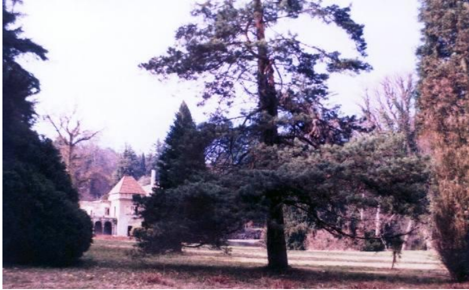
Rijetki primjerci drveća zasađeni u Arboretumu u vrijeme Bomebellesa