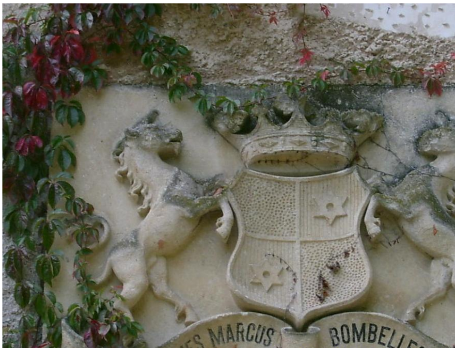
Grb plemićke obitelji Bombelles iznad ulaza u dvorac