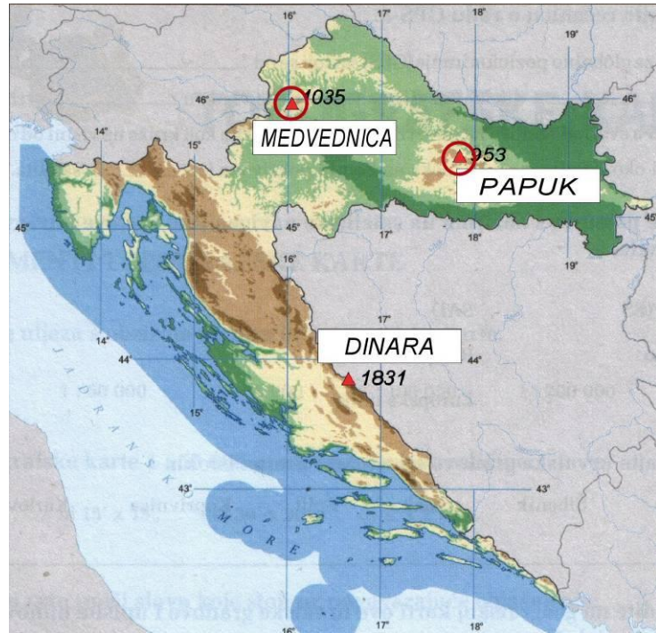
KARTA UZ 21. i 22. ZADATAK